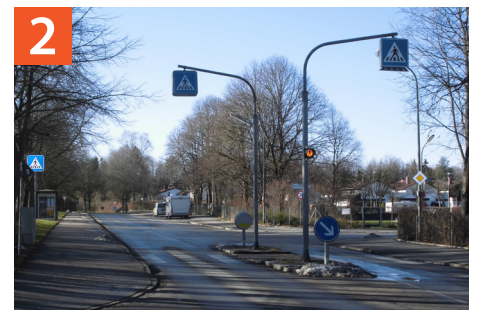
Fußgängerüberweg Lindenring / Pappelstraße