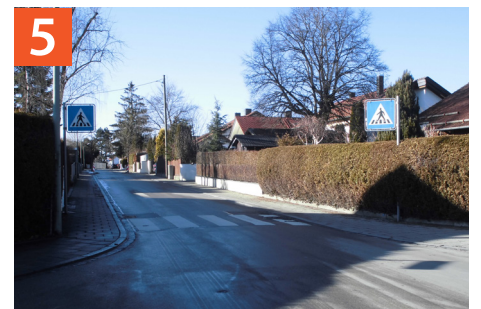
Fußgängerüberweg Hohenbrunner Weg / Rosenstraße