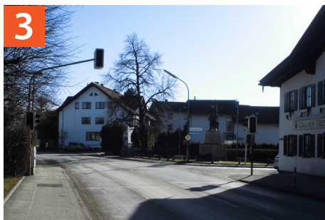
Fußgängerampel Münchener Straße / Ritter-Hilprand-Straße