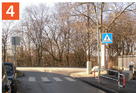
Fußgängerüberweg Dorfstraße / Edelweißstraße