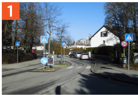
Fußgängerüberweg Lindenring / Köglweg

Bitte melden Sie sich bei der Schule, dem Elternbeirat oder bei der Polizei.